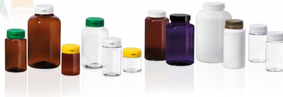
Pill and capsule jars