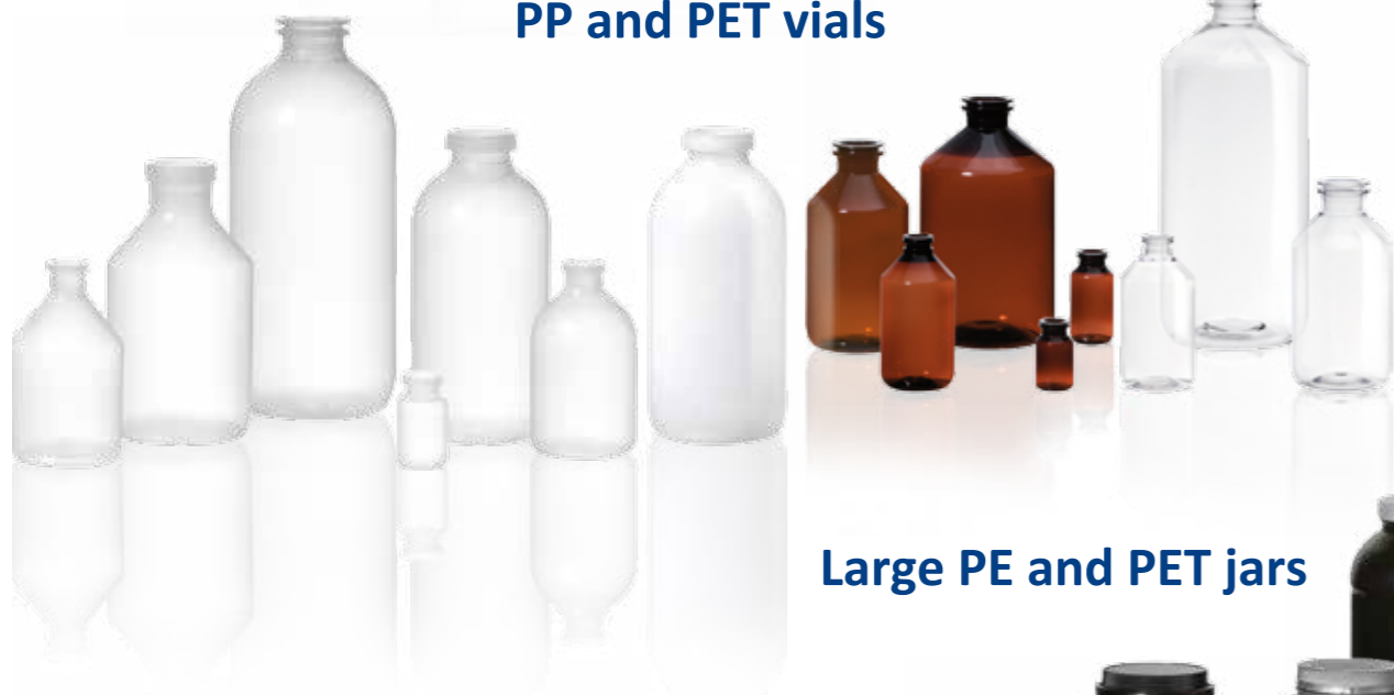
PP and PET vials